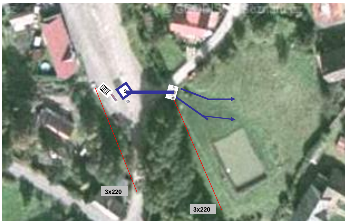
Obr. 1 – Pohled na místo konání soutěže